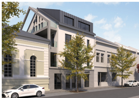
Agapé, pohled z Hronovické ulice

Ani bez příspěvků od členů našeho sboru se neobejdeme. Velmi by nám pomohlo, pokud by se v rámci našeho sboru podařilo na tento projekt vybrat alespoň 1–2 miliony korun. Je to velká částka, ale není nás na ní málo. V průměru na každého aktivního člena našeho sboru představuje příspěvek zhruba 10–15 tis. Kč. Čím více peněz dáme dohromady, tím spíše se nám podaří projekt dotáhnout do konce celý. Číslo bankovního účtu zřízeného naším sborem speciálně pro financování projektu Aga-