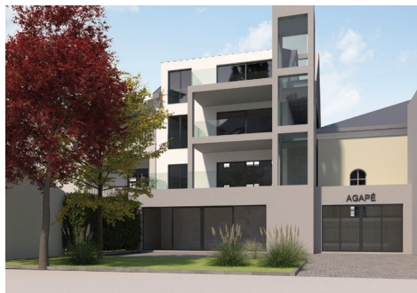
Agapé, pohled ze dvora domu 669